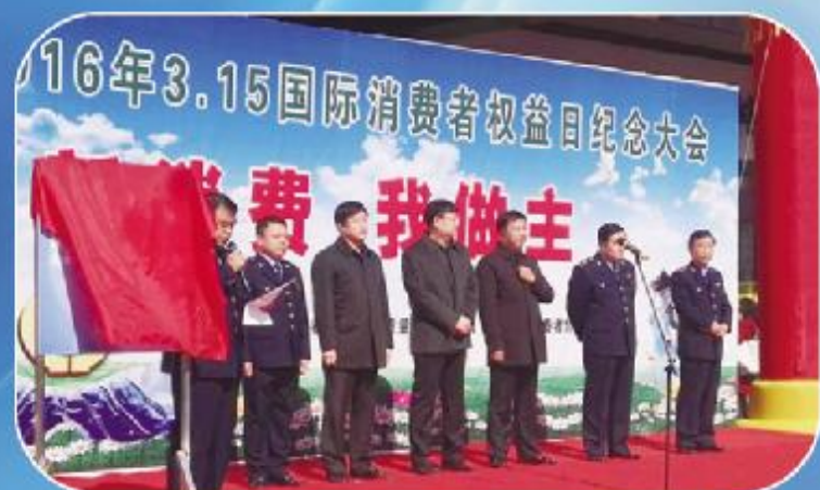
阳春市运管所开展了“3·15服务质量月”宣传活动，通过纪念大会、张贴宣传标语、悬挂横幅、发放传单等街头宣传形式，提升了广大消费者的维权意识。