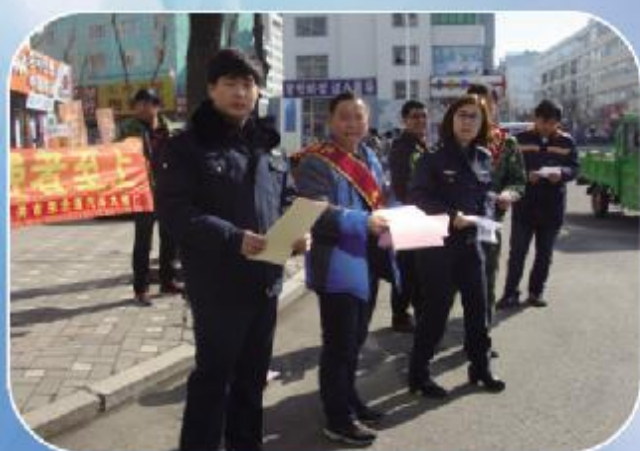
3月15日，龙井市运管所组织三家龙头企业从业人员在龙井市区内，讲解辨别真伪汽车配件及用品的常识，同时发放宣传单500余份。