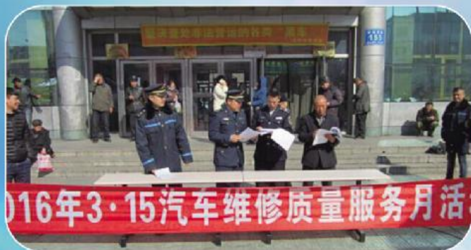
3月15日当天，长岭县运管所在客运站前广场设立咨询服务台，组织远达、宏源等维修企业开展义诊咨询活动。