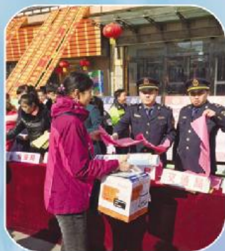
江源区运管所联合区工商局、质监局在区金鼎大厦门前等地组织发放宣传资料、宣传单，提高消费者防范意识。