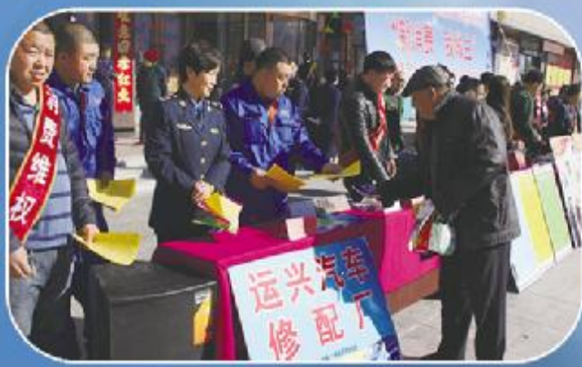
赣南市运管所组织部分维修企业开展“2016消费者权益日”系列活动，鼓励经营服务人员与企业职工主动参与维权服务，发放宣传单。