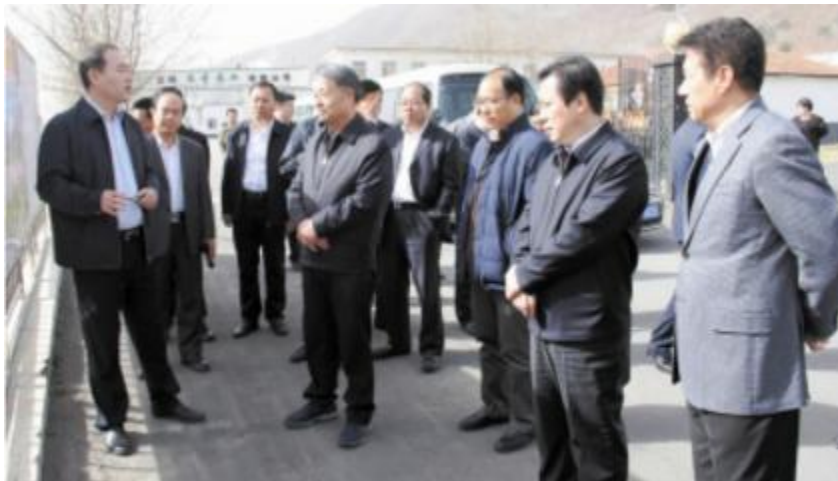
图：杨传堂部长在姜有为副省长、常晓春厅长陪同下，在集安市上活龙村调研农村公路建设等情况。

4月8日、9日，交通运输部党组书记、部长杨传堂就贯彻落实《中共中央国务院关于全面振兴东北地区等老工业基地的若干意见》，加快推进东北地区交通运输基础设施建设到我省开展调研，并主持召开东北四省区座谈会。杨传堂在调研时强调，要深入贯彻党的十八届五中全会、中央经济工作会议和全国“两会”精神，落实党中央、国务院关于全面振兴东北地区等老工业基地的战略部署，坚定信心，保持定力，通过部省通力合作，全面推进综合交通运输发展，为东北地区全面振兴提供坚实支撑和保障。