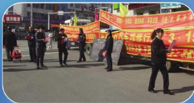
东宁县运管所组织全县户内汽车维修企业开展了“汽车消费者维权宣传日”活动。